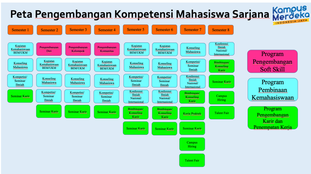
Gambar 4. Peta Pengembangan Kompetensi Mahasiswa Sarjana