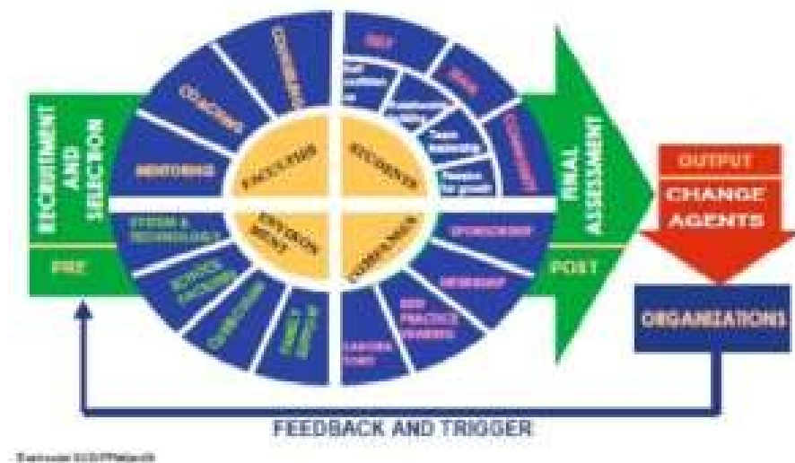
Gambar 5. Model Pengembangan Soft Skill STM PPM

Pada kurikulum PPM School, terdapat tiga mata kuliah yang terutama ditujukan untuk pengembangan soft skills . Ketiga mata kuliah tersebut adalah: mata kuliah Pengembangan Diri ( Self Development ), Pengembangan Kelompok ( Team Development ), dan Pengembangan Masyarakat ( Community Development ). Pembinaan soft skills ini juga terintegrasi di semua mata kuliah. Bentuk pengembangan soft skills pada mahasiswa difokuskan pada pengembangan 4 (empat) soft skills , yaitu :