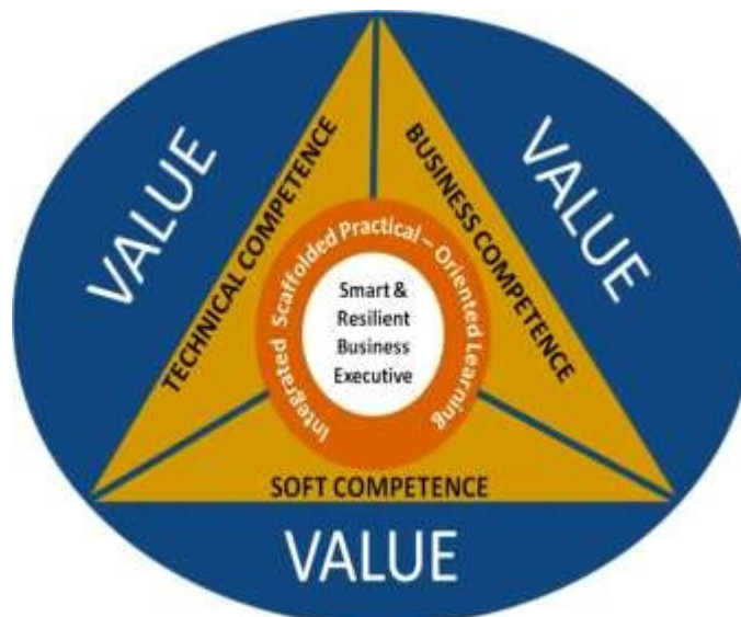
Gambar 2. Model Bangun Kurikulum Program Sarjana

Model ISP Learning tersebut secara konsisten diarahkan untuk membangun kompetensi teknis dan perilaku yang berlandaskan pada nilai-nilai luhur. Model bangun kurikulum Program Sarjana diilustrasikan pada Gambar 2. Secara rinci, elemen-elemen yang dikembangkan melalui proses pembelajaran meliputi empat hal utama yakni: Sikap, Pengetahuan, Keterampilan Umum dan Keterampilan Khusus. KKN Program Studi Sarjana Manajemen dijabarkan pada lampiran buku pedoman ini.